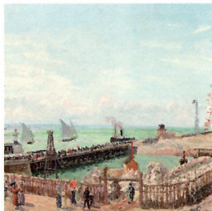
La jetée du Havre, Haute mer, soleil matin, PISSARRO

En une quarantaine d'œuvres issues pour la plupart de collections privées, Pissarro explore le thème du port industriel, accompagné par Boudin ou Mauffra et suivi des contemporains Dufy, Friesz et Marquet qui amènent doucement la tentation de la couleur et du fauvisme.