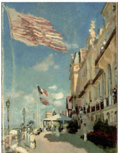
Hôtel des roches noires, MONET , Trouville, 1870. Huile sur toile.

Manet, Monet, Degas, Boudin, Berthe Morisot, Seurat, Bonnard, Gauguin, Renoir... Tous ont été fascinés par la mer, les loisirs et les sports qui l'entourent.