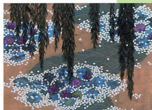
Reflets de nuages dorés sur l'étang, 2011, HIRATSUO REIJI

Monet, influencé par l'art japonais, aura été source d'inspiration pour le peintre Hiratsuo. Les deux artistes sont réunis à l'occasion de cette exposition, ainsi que plusieurs estampes japonaises, de Hokusai à Hiroshige.