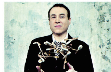
Jean-François Zygel